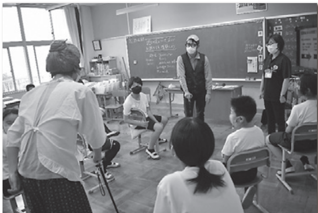
【社協劇団ひまわり 寸劇を通して伝える認知症】

ふくし相談事業（無料法律相談・心配ごと相談など）・『社協劇団ひまわり』・『社協だより』の発行・『福祉フェスティバル』開催 など