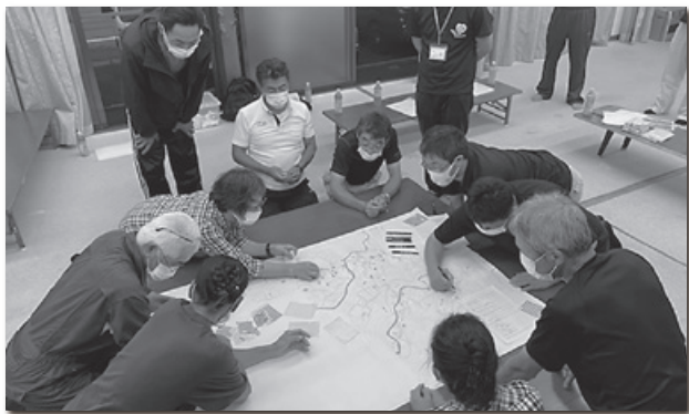
【高鷲地域 自治会での福祉懇談】

地区社協活動・サロン活動・地域支え合い活動 ボランティア活動・福祉委員活動 など