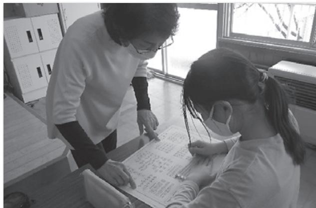
【大中小福祉体験学習 点字体験】

学校における福祉体験学習・ふくし見学会・介護職員初任者研修・車いす搭載可能車両や車いすの貸与・こども助成 など